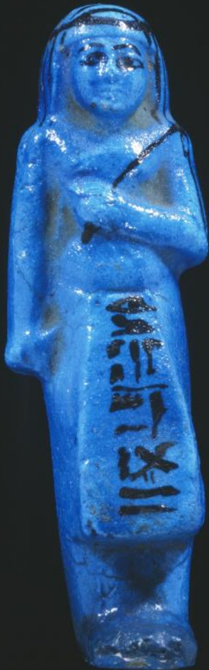
Égypte, Troisième période intermédiaire, Ouchebti de Pinedjem Ier , vers 1032 av. J.-C., faïence, Paris, musée du Louvre.