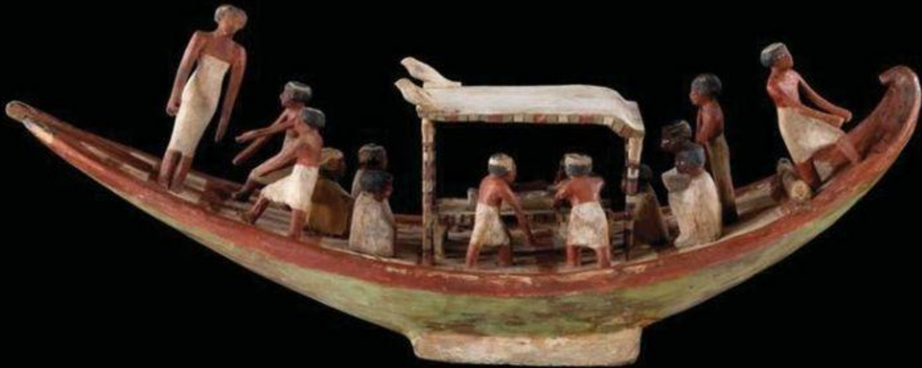
Égypte, Moyen Empire, Modèle de barque , vers 1700/1600 av. J.-C., bois peint, Paris, musée du Louvre.