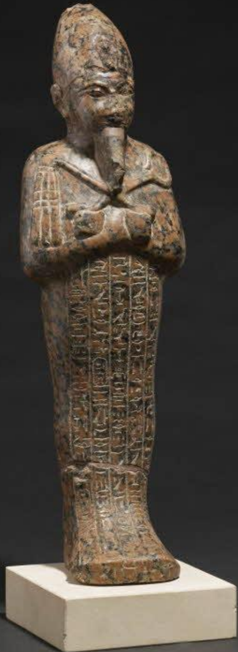
Égypte, Nouvel Empire, Ouchebti d'Aménophis III , 1391/1353 av. J.-C., granite, Paris, musée du Louvre.