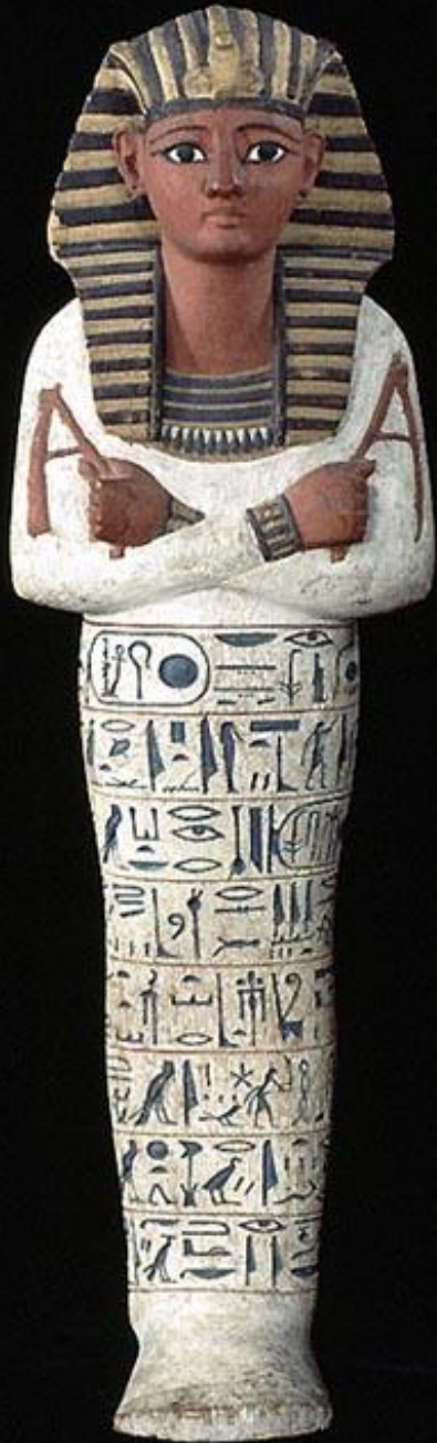
Égypte, Nouvel Empire, Ouchebti de Ramsès IV , 1153/1147 av. J.-C., bois peint, Paris, musée du Louvre.