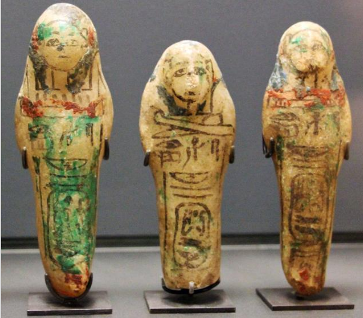
Égypte, Nouvel Empire, Ouchebtis de Ramsès VI , vers 1137 av. J.-C., albâtre peint, Paris, musée du Louvre.