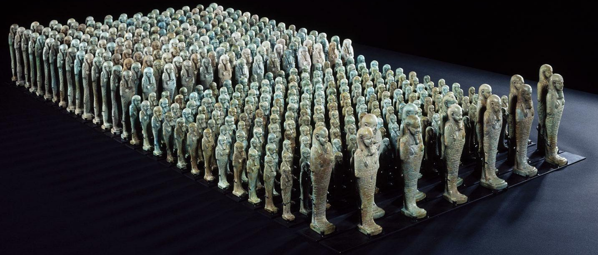
Égypte, Basse époque, Ouchebtis de Néferibrêheb , vers 500 av. J.-C., faïence, Paris, musée du Louvre.