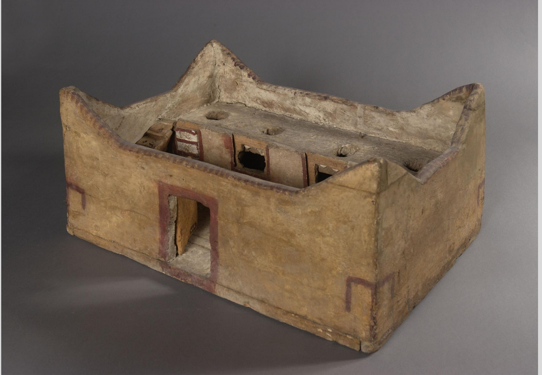
Égypte, Moyen Empire, Modèle réduit de grenier , vers 1900 av. J.-C., bois peint, Paris, musée du Louvre.