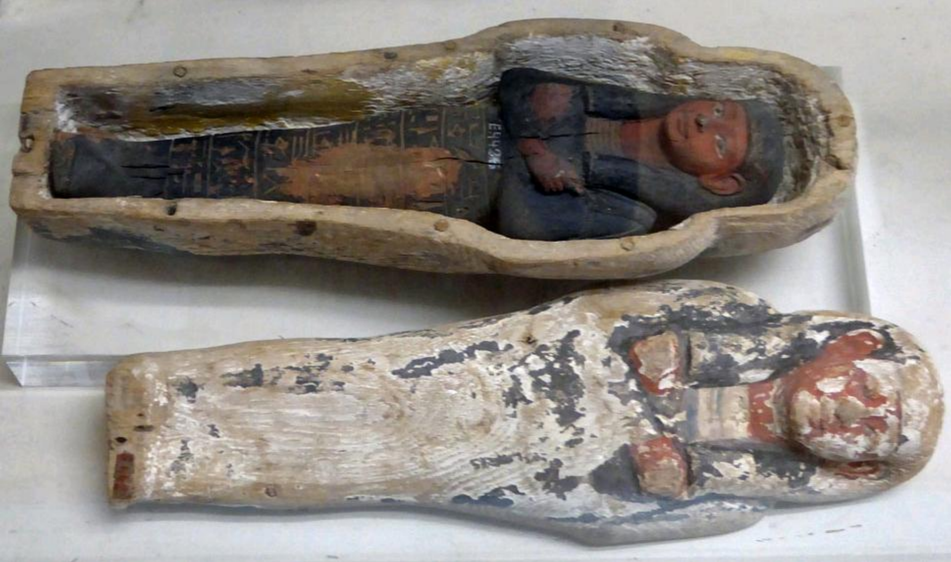
Égypte, Moyen Empire, Ouchebti en sarcophage , vers 1800 av. J.-C., bois peint, Bruxelles, musées royaux d'Art & d'Histoire.