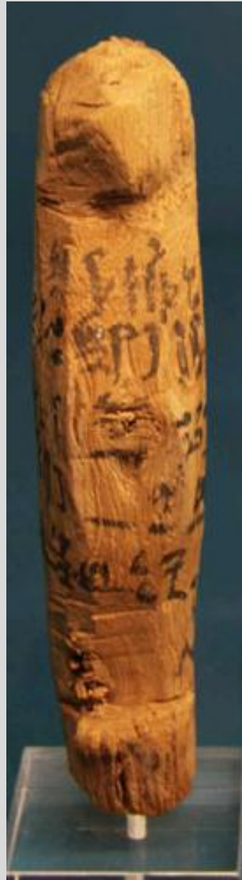
Égypte, Moyen Empire, Ouchebtis , vers 1800 av. J.-C., bois peint, Berlin, musée Dhalem.