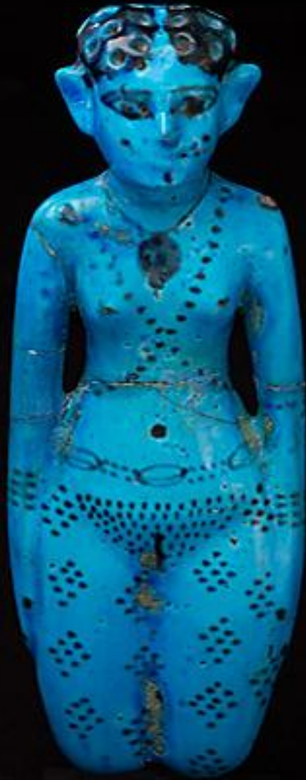
Égypte, Moyen Empire, « Concubine du mort », 1900/1800 av. J.-C., faïence, Paris, musée du Louvre.