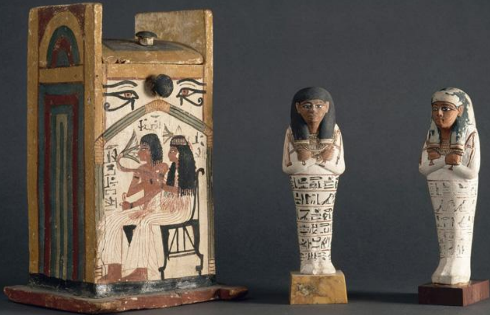
Égypte, Nouvel Empire, Ouchebtis de Khâbekhent (artisan des tombes royales de Deir el-Médineh), vers 1250 av. J.-C., calcaire et bois peint, Paris, musée du Louvre.