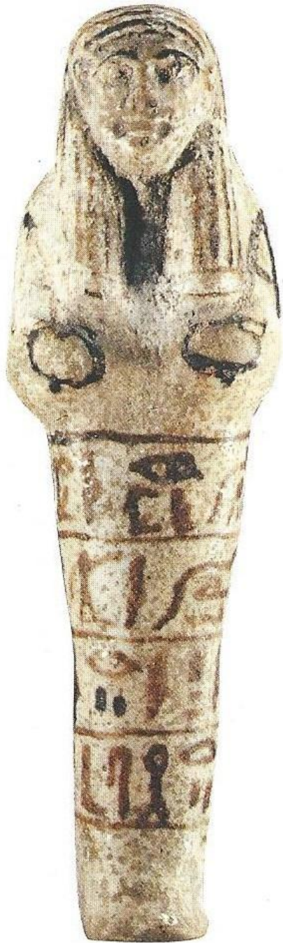
Égypte, Nouvel Empire, Ouchebti de Ipou , vers 1100 av. J.-C., faïence, Chalon-sur-Saône, musée Vivant Denon.