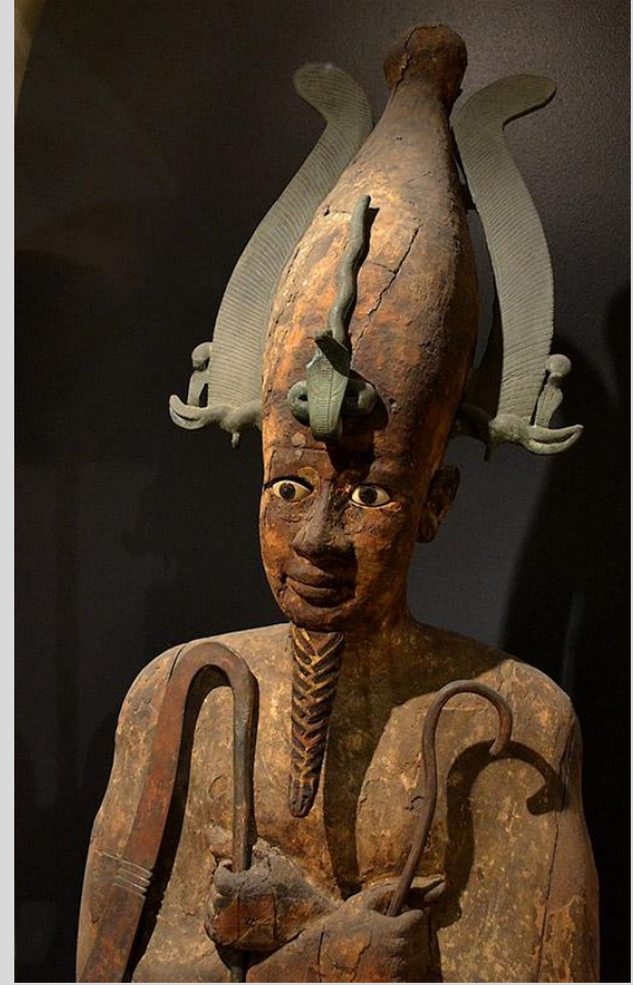
Égypte, Basse époque, Osiris , vers 300/50 av. J.-C., bois peint, verre et bronze, Paris, musée du Louvre.