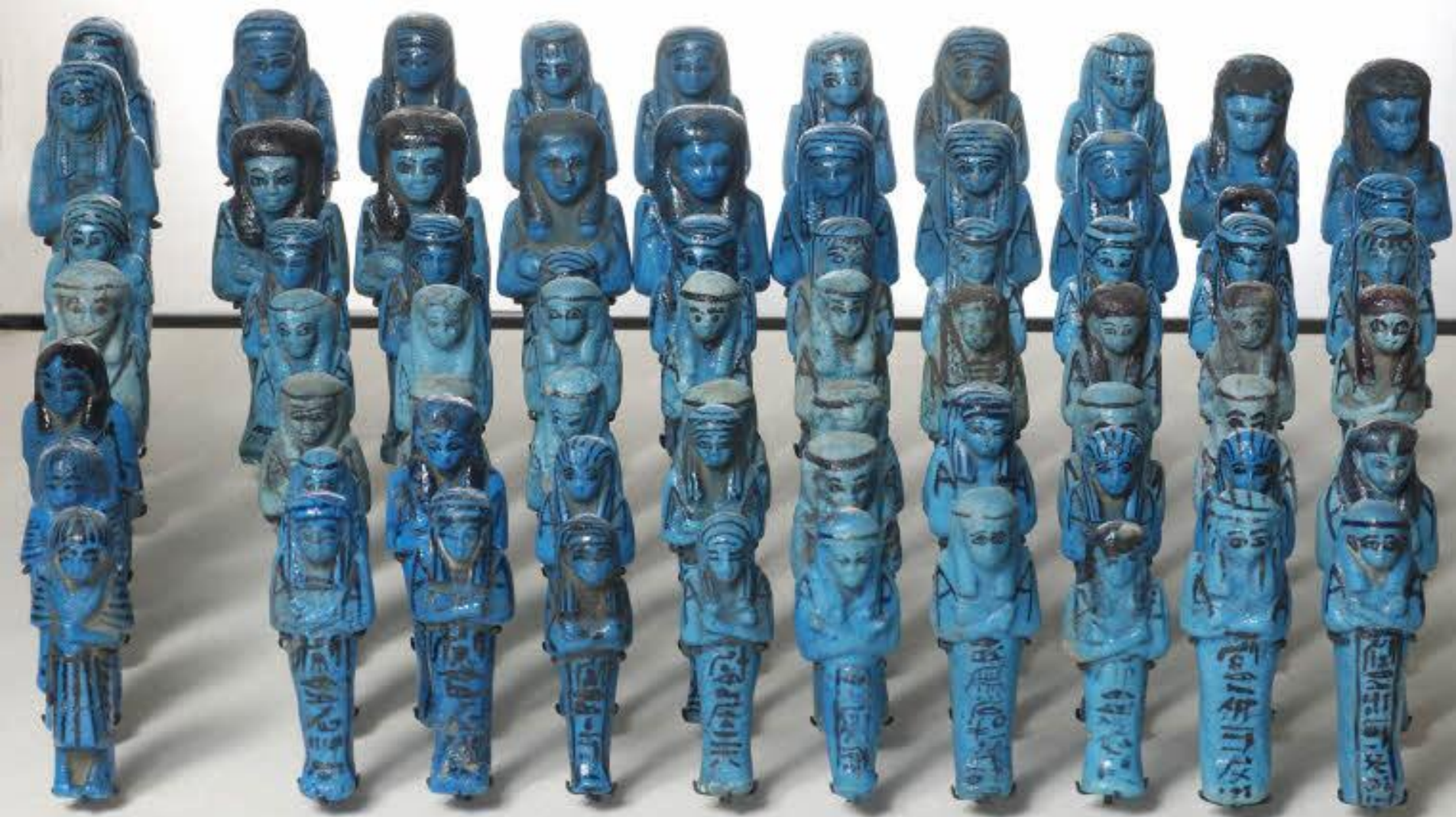
Égypte, Troisième époque intermédiaire, Oucheftis , vers 1069/945 av. J.-C., faïence, Paris, musée du Louvre.