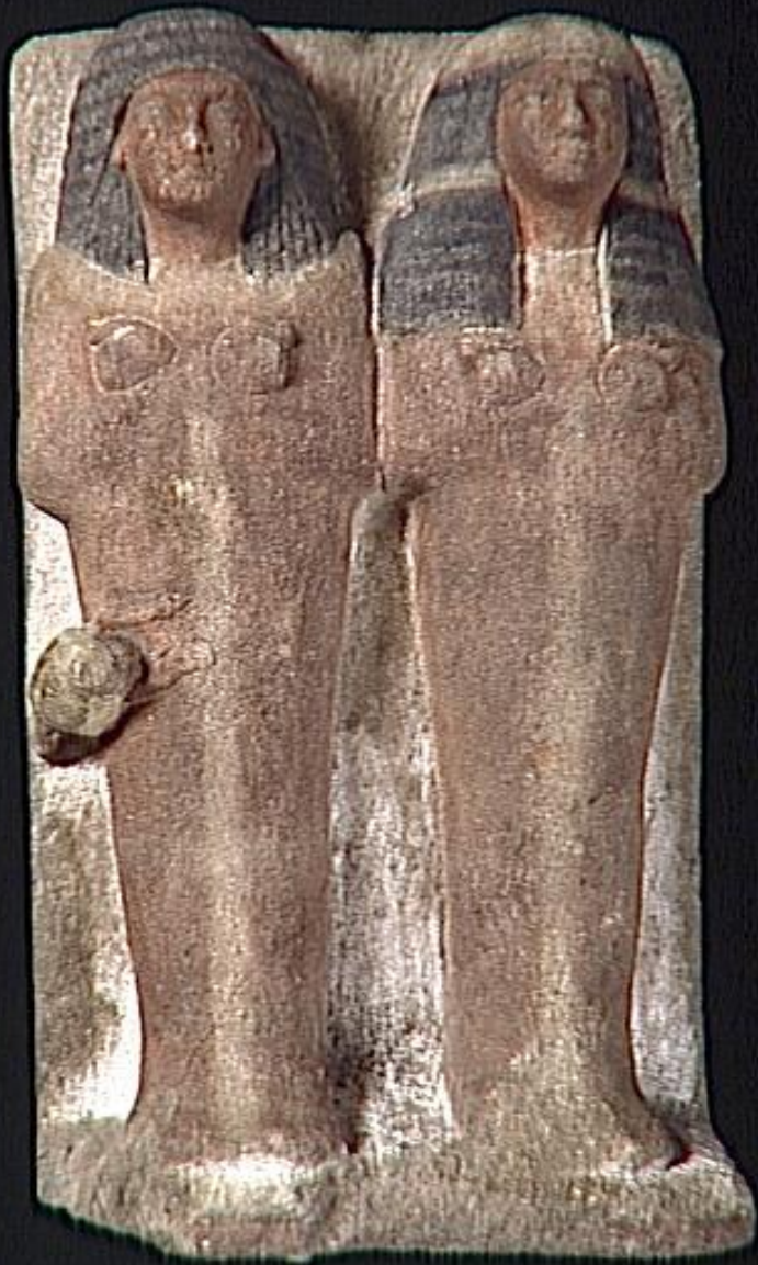
Égypte, Nouvel Empire, Ouchebti de type gisant double de l'intendant Pay et de son épouse Repet avec l'oiseau Bâ, vers 1500/1100 av. J.-C., grès peint, Paris, musée du Louvre.