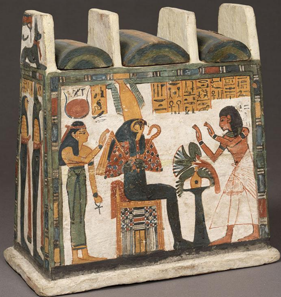
Égypte, Nouvel Empire, Coffret à ouchebtis , vers 1290/1070 av. J.-C., bois peint, Paris, musée du Louvre.