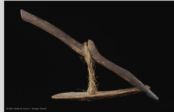
Égypte, Basse époque, Houe , vers 700 av. J.-C., bois et fibres, Paris, musée du Louvre.