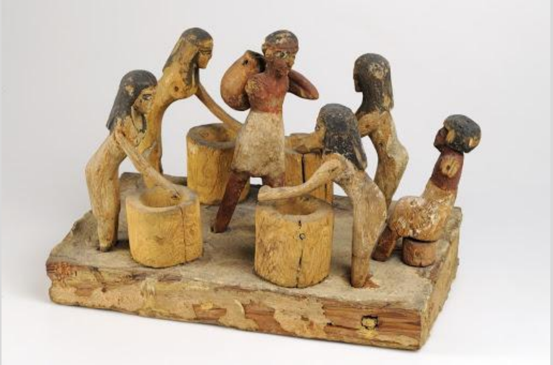
Égypte, Moyen Empire, Modèle : brassage de la bière , vers 1700/1600 av. J.-C., bois peint, Lyon, musée des Beaux-Arts.